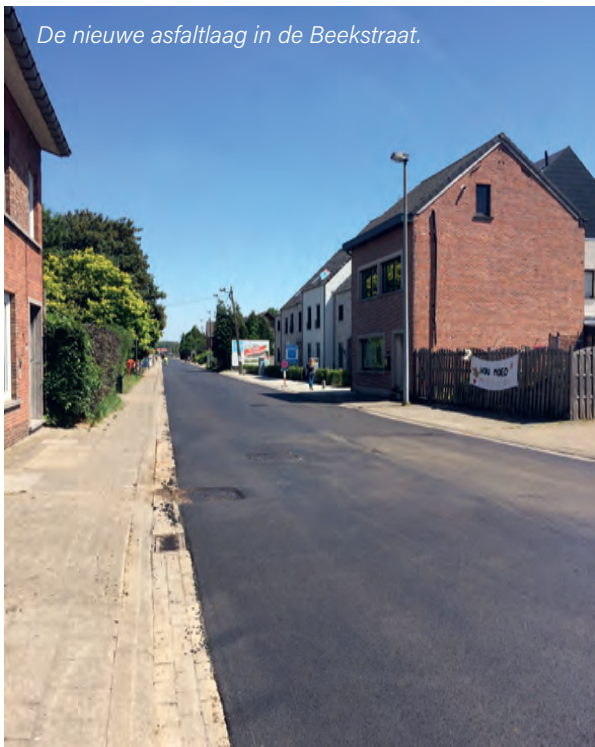
De nieuwe asfaltlaag in de Beekstraat.

Om de slechte staat van het wegdek aan te pakken, kreeg de Beekstraat een nieuwe asfaltlaag. Na de zomer voorziet de gemeente in het eerste deel van de straat ook fietssuggestiestroken.