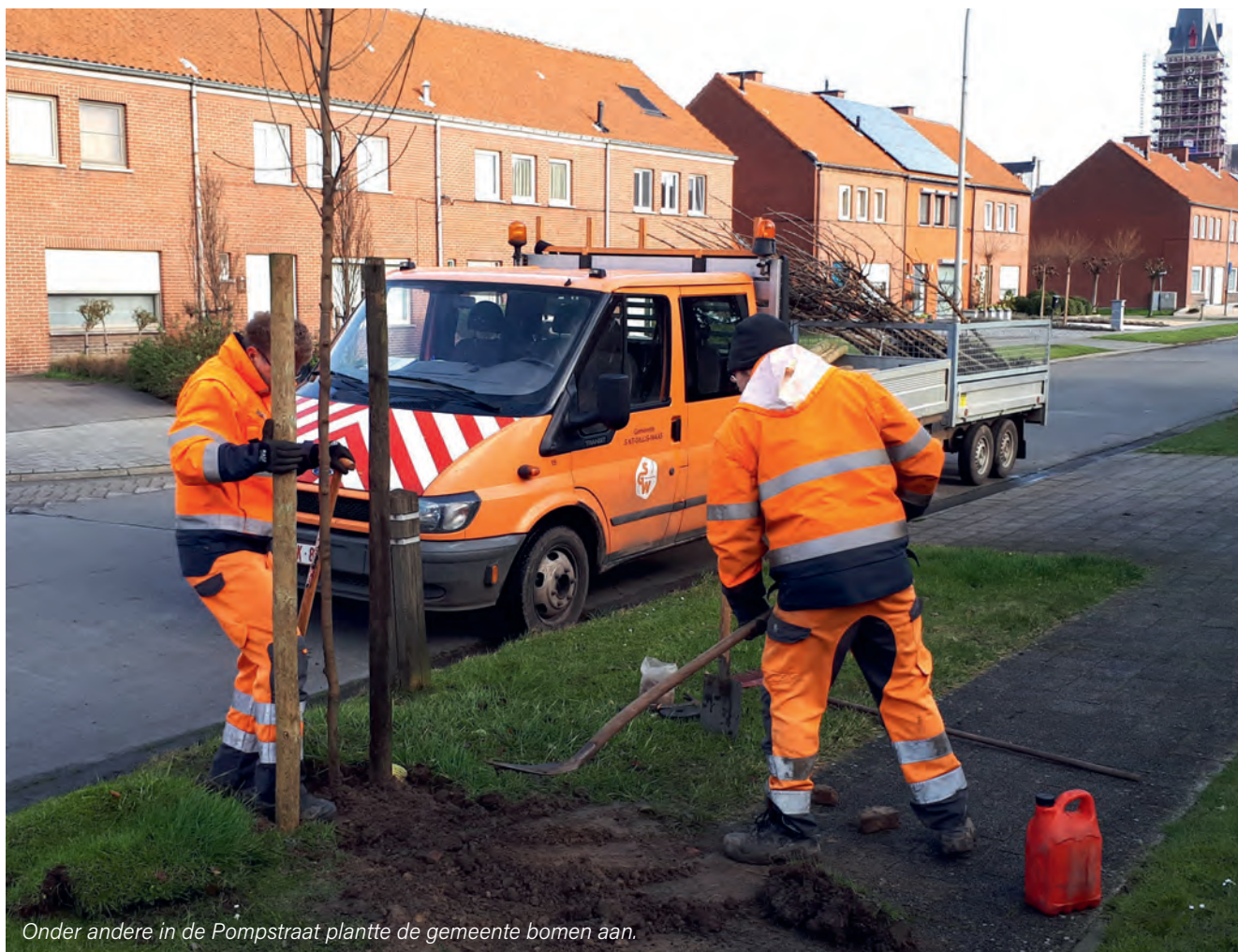
Onder andere in de Pompstraat plantte de gemeente bomen aan.

MEER INFO? Groen, 03 727 17 00, groen@sint-gillis-waas.be