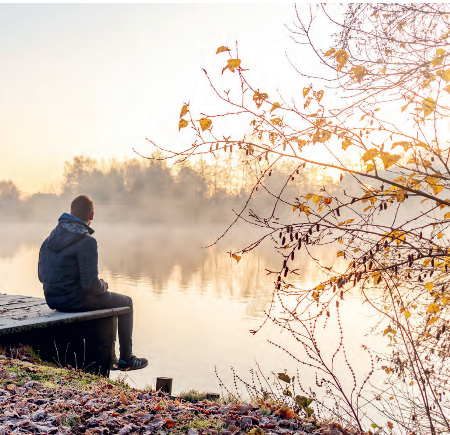
Deze prachtige foto van de visput in 't Kalf kreeg de meeste stemmen in onze zoektocht naar een nieuwe omslagfoto op Facebook.